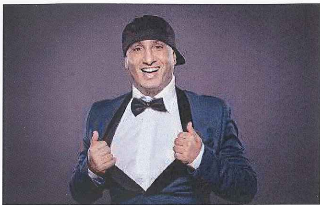
« On me dit souvent que ce spectacle est un hymne à la vie. »

Portugais, le personnage qui vous a fait connaître ?