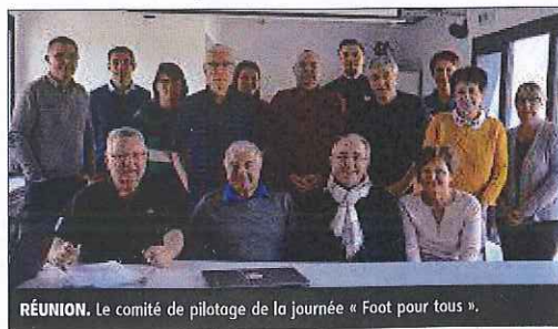
RÉUNION. Le comité de pilotage de la journée « Foot pour tous ».

250 participants sont attendus lors de cette journée organisée par Ligue Aura de football et les ligues Aura de sport adapté et